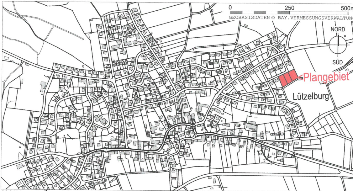
Abbildung 1: Übersichtslageplan Baugebiet, Maßstab 1:10.000, ALKIS, Bayerische Vermessungsverwaltung – www.geodaten.bayern.de

Die Lage des Plangebietes ist dem nachstehend abgedruckten Lageplan zu entnehmen.